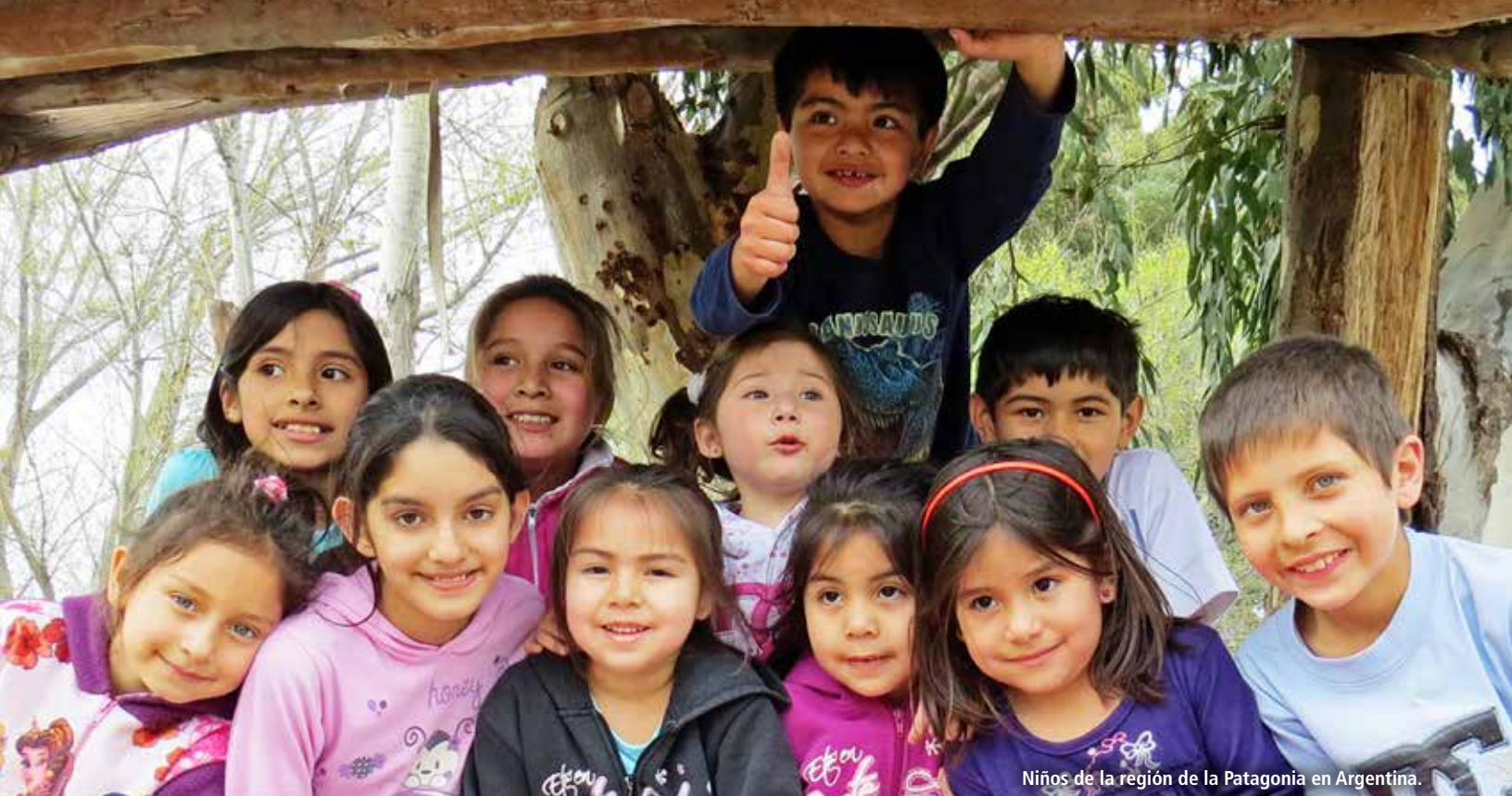
Niños de la región de la Patagonia en Argentina.

Corta o dobla, publica y usa este versículo para la contemplación y la oración a lo largo del próximo mes.